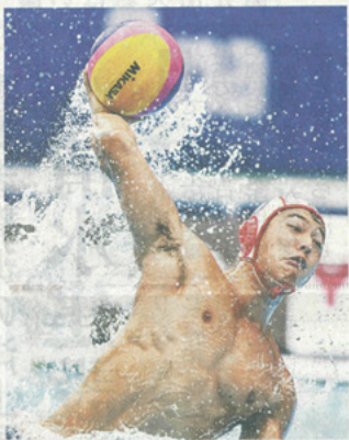
世界選手権で強烈なシュートを放つ 2019年7月 韓国・光州